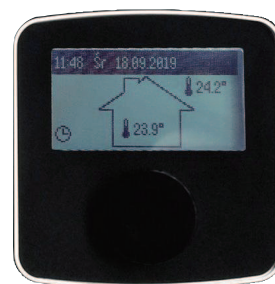
Automatizare ușor de folosit

Prin utilizarea unor module adecvate, cazanul electric poate funcționa împreună cu un acumulator pentru agent termic. Acumularea agentului termic în afara perioadelor de vârf al tarifelor pentru electricitate, asigură costuri și mai reduse pentru încălzire. Vitotron 100 poate funcționa împreună cu orice sistem pentru încălzire și cu orice boiler pentru apă caldă menajeră. Este echipat cu un vas de expansiune cu un volum de 5 litri și cu accesoriile de siguranță necesare. Atunci când funcționează împreună cu un boiler pentru prepararea apei calde menajere, este posibil reglajul temperaturii apei și instalarea unei pompe pentru recirculare, cu setări zilnice și săptămânale.